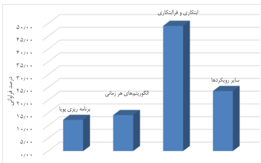
نمودار ۱. توزیع آماری رویکردهای حل مسئله ایجاد ساختار ائتلاف

رویکرد پژوهشی دوم که در حوزه نظریه بازی‌های همکارانه قرار می‌گیرد [۳، ۲۴، ۲۷، ۲۸، ۳۲]، تنها به بررسی نحوه توزیع عایدی میان عامل‌ها می‌پردازد؛ به گونه‌ای که ائتلاف شکل گرفته پایدار باشد؛ اما توجهی به مسئله ایجاد ساختار ائتلاف بهینه ندارد [۱۹]. پی بردن به نقش اساسی و