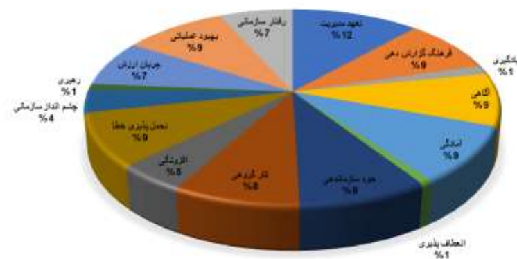
شکل ۲. وزن شاخص‌های اثرگذار

با توجه به جدول ۷، میانگین شاخص کارایی برای حالت حضور همه عوامل با میانگین شاخص کارایی مربوط به حذف عامل قابلیت اطمینان متفاوت است. با مقایسه میانگین مقادیر کارایی پیش از حذف این شاخص و پس از حذف آن مشخص می‌شود که پس از حذف شاخص تعهد مدیریت، کارایی کاهش زیادی داشته که این امر حاکی از تأثیر مثبت این عامل است؛ به عبارت دیگر این شاخص به خوبی اجرا شده است و عملکرد مناسبی دارد. همین تحلیل برای شاخص‌های آگاهی، فرهنگ گزارش دهی، آمادگی، خودسازمان دهی، کارگروهی، تحمل پذیری خطا و بهبود عملیاتی نیز صدق می‌کند. متوسط مقدار کارایی بعد از حذف دو شاخص جریان ارزش و رفتار سازمانی افزایش یافته است که تأثیر منفی این دو شاخص بر مقدار کارایی کل را نشان می‌دهد. از طرفی از آنجاکه P-Value آن‌ها از ۰/۰۵ کمتر است، نشان می‌دهد که این دو شاخص اثرگذار هستند؛ از این رو بر اساس نتایج جدول ۷، شاخص‌های چشم‌انداز سازمانی، رهبری، افزونگی، انعطاف‌پذیری و یادگیری از نظر آماری در سطح معناداری ۰/۰۵، فاقد تأثیر معنادار بر عملکرد کل هستند. وزن هر یک از شاخص‌ها در شکل ۲، نشان داده شده است.