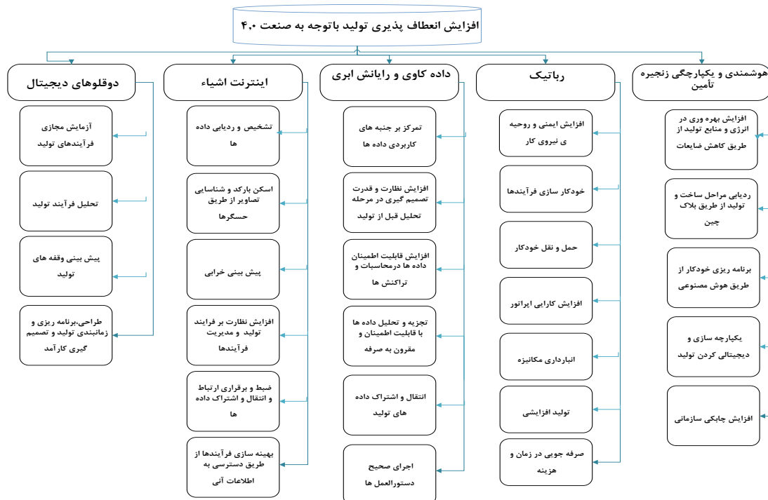
شکل ۲. معیارها و زیرمعیارهای نهایی برای افزایش انعطاف پذیری تولید در شرکت‌های کوچک و متوسط فناوری محور بین‌المللی