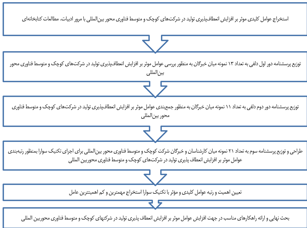
شکل ۱. مراحل انجام پژوهش