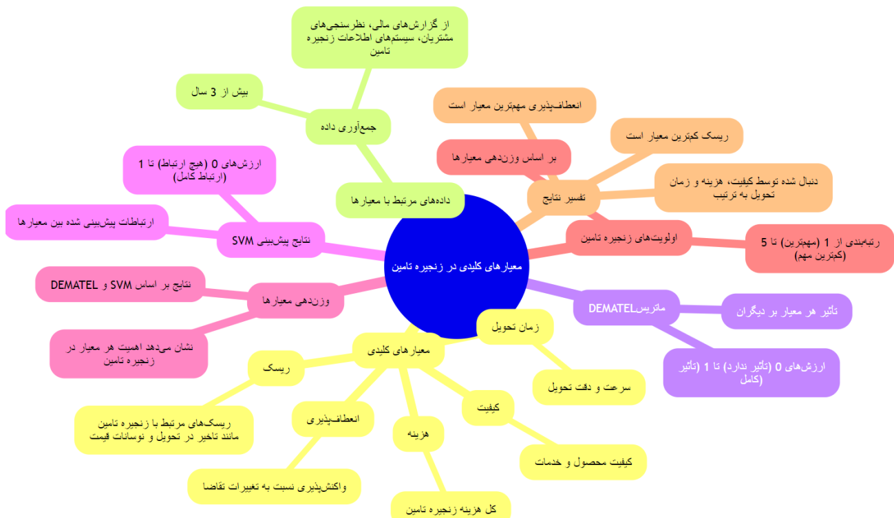
شکل ۱. نقشه ذهنی روش پیشنهادی

در این مقاله از نقشه ذهنی برای ارائه بصری مفاهیم پیچیده و ایجاد انسجام و سازماندهی در مطالب استفاده شده است. نقشه ذهنی به خواننده کمک می‌کند تا روابط بین ایده‌ها و مفاهیم مختلف را به طور واضح درک کند و چارچوب کلی مقاله را به سرعت درک کند. بر اساس روش پیشنهادی نقشه ذهنی این مقاله در شکل ۱ نشان داده شده است. این نقشه ذهنی مفاهیم کلیدی این مقاله که به‌طور سیستماتیک به بررسی و اولویت‌بندی معیارهای زنجیره تامین می‌پردازد را شامل می‌شود. این مراحل روش جمع‌آوری داده، اعمال SVM و DEMATEL به منظور وزن‌دهی معیارها، تفسیر نتایج و در نهایت رتبه‌بندی معیارها است.