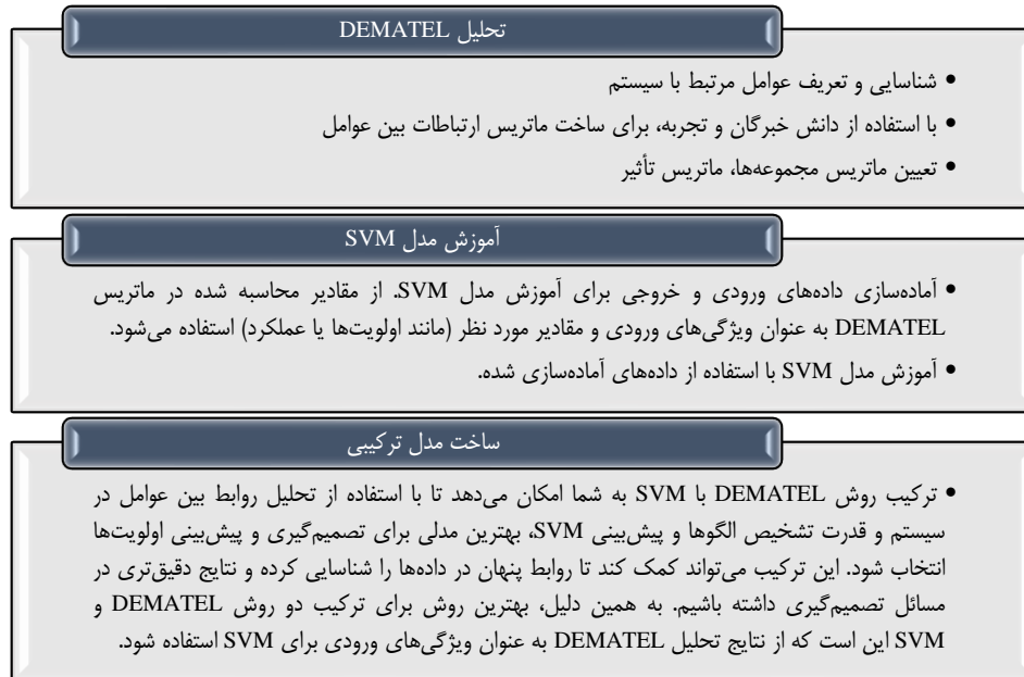
شکل ۲. گام‌های کلیدی تحلیل پژوهش

ترکیب روش DEMATEL با SVM سبب شد تا با استفاده از تحلیل شبکه‌ای داده‌های تجزیه و تحلیلی بسط داده‌های ماتریسی در DEMATEL و قدرت پیش‌بینی SVM، به نتایج دقیق‌تری در مسائل تصمیم‌گیری برسیم. مراحل تحلیل در شکل ۲ بیان شده است: