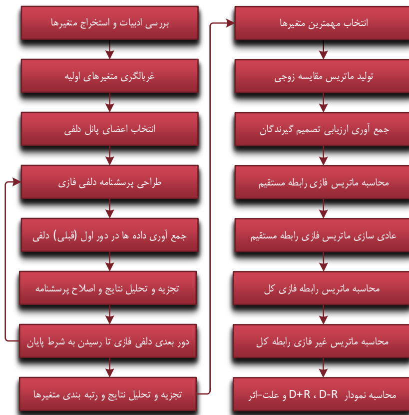
شکل ۱. مراحل انجام روش دلفی و دیمتل فازی

روش دلفی فازی: روش دلفی فازی، به عنوان یکی از پیشرفته‌ترین نسخه‌های روش دلفی، از اعداد فازی مثلثی برای خلاصه کردن دیدگاه‌های به دست آمده از روش دلفی استفاده می‌کند [۱۰]. مهم‌ترین مزیت این روش، سادگی آن در جمع‌آوری دیدگاه‌های کارشناسان و توانایی آن در دستیابی به نتایج واقعی‌تر و دقیق‌تر از طریق انتخاب معیارها است [۲۳]. تکنیک دلفی فازی می‌تواند ابتدا برای شناسایی و غربال مهم‌ترین شاخص‌های تصمیم‌گیری و ایجاد هسته ابتدایی پژوهش برای پژوهشگر استفاده شود. [۳] در این روش برای دستیابی به یک سطح مناسب از توافق بین متخصصان، نیازی به اجرای چندین دور نیست و معمولاً یک سطح مناسب توافق با سرعت بیشتری حاصل می‌شود؛ همچنین در دلفی سنتی، افرادی که عقایدشان تغییر نمی‌کند ممکن است از مطالعه حذف شوند و در نتیجه ممکن است برخی از اطلاعات از بین برود؛ اما در روش دلفی فازی، هیچ فرد یا اطلاعاتی مستثنا نیست [۱۹]. مراحل روش دلفی فازی در همه روش‌های مختلفی که ارائه شده است، شباهت زیادی با روش دلفی معمولی دارد. در حقیقت